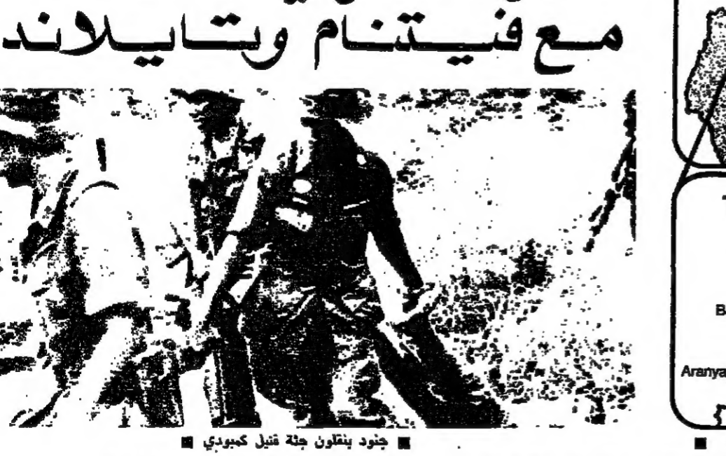
جنود يتقاتلون جولة قبل كمبودي

تاييلاند تحاول المواجهة جيش نيلاند حول بركل فراه مواجهة موجات المهاجرين الذين يتدفقون على الرغم من تطويق كمبوديا بارض مجردة عرضها ٦ ايام ودرعها بالاقلام. وتوقع وكالة الغضاء الاوروبية التي اشركت فيها عشر دول هي بلجيكا، بريطانيا، هولندا، ألمانيا، السويد، وسويسرا، ان تصل المبالغ اللازمة لتأمين قبح ثقل الى ١٠٠ الف فرنك، نصفها لوكالة الغطاء الاطلاق، لكن الخسارة في مجال الامداد الاصطناعية المخصصة للتصالحات، حتى انهم يفتقدون وكالة الاستخبارات المركزية بتنبؤ. ينس الوقت على قبر اخر احد